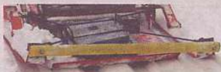
Det är gott om snö vid Vreta skidstadion. Ett snödjup på cirka 40 centimeter ger fina spår.

– Förstudien är klar och nu går vi in i ett skede där vi på olika sätt försöker finna